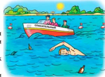
Не заплывайте за ограничительные знаки мест, отведённых для купания! Не подплывайте к большим судам, весельным лодкам, баржам.